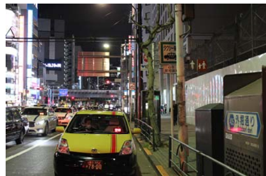
東京都港区新橋 1-9 銀座 9 号

銀座 9 号タクシー乗り場は、第一京浜及び昭和通りに直結し城南・城東地区方向等への利用に適しており、銀座のタクシー乗り場の中でも稼働台数が多く、優良タクシー乗り場の運用により利用者への更なるタクシーサービスの向上を推進するとともに優良事業者等の運転者へのインセンティブ効果を図ります。