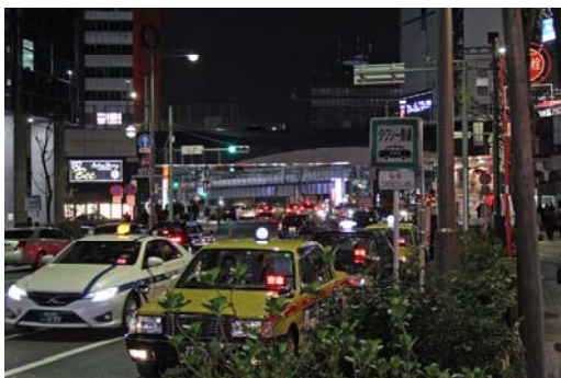
東京都中央区銀座 8-3 銀座 2 号

銀座 2 号タクシー乗り場はコリドー街の入り口にあり、近年コリドー街はリーズナブルな飲食街へと変貌し、多くのサラリーマンやOLで賑わっています。そのため訪日外国人観光客を含めさらなるタクシーの稼働が見込まれ、優良タクシー乗り場の運用により一層のタクシーサービスの向上を推進します。