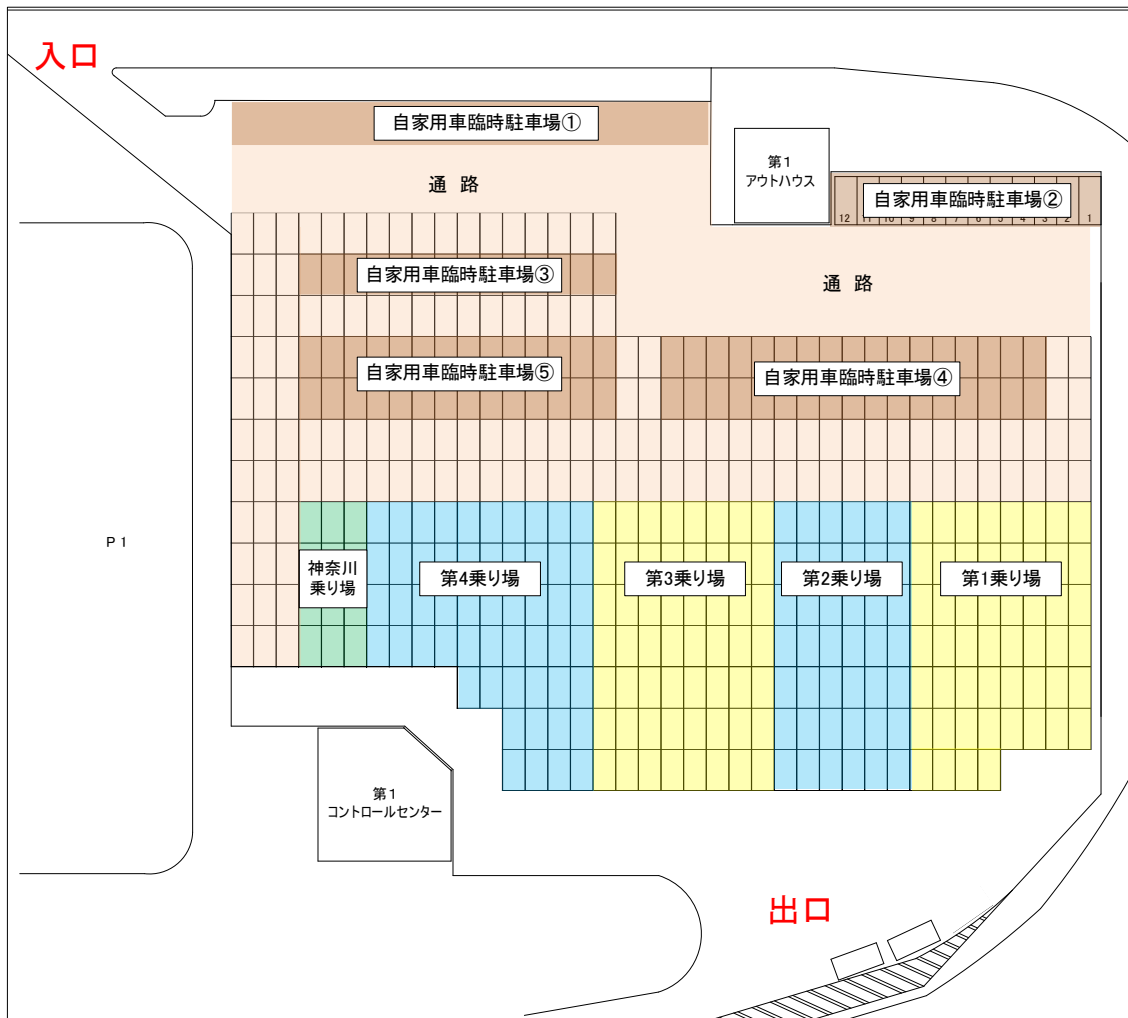
図1 第1タクシー待機所