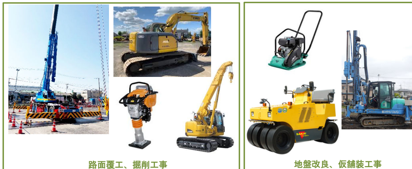
路面覆工、掘削工事

下記写真のような機械での作業となります。騒音、振動には十分に配慮して作業を行います