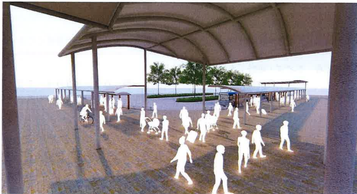
(亀有駅南口出入口付近)