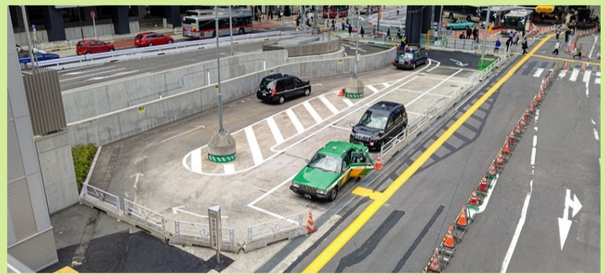
渋谷駅西口前優良タクシー乗り場