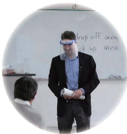
外国人旅客接遇研修