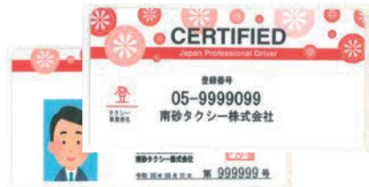
運転者証(法人タクシー)