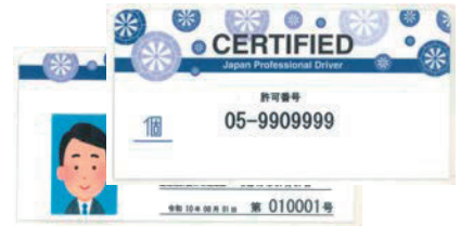
事業者乗務証(個人タクシー)