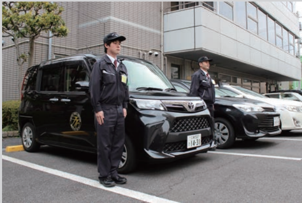
指導員及び指導車

運送の引受けの拒絶等の違法行為の防止及び是正を図るため、指導員により広範囲なパトロールを実施しています。