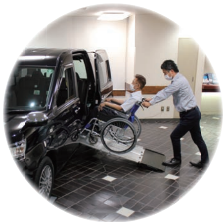
ユニバーサルドライバー研修