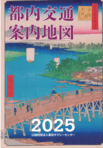
都内交通案内地図 2025 (頒布中)

教務部では、これまで毎年1月に都内交通案内地図を刊行しておりましたが、令和6年2月29日(木)の旅客自動車運送事業運輸規則第29条(地図の備付け)の改正により、製本地図の需要が減少していることから、令和8年1月の刊行は見合わせ、延期とさせていただきます。 令和7年1月に刊行いたしました都内交通案内地図2025は、令和8年1月以降も引き続き2階教務部窓口にて頒布いたします。 なお、最新版の刊行につきましては、センターニュース等で改めてお知らせいたします。