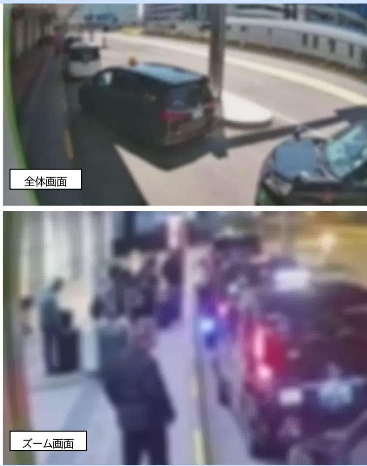
羽田空港第4タクシー乗り場 定点監視システムの静止画像

令和7年4月25日(金)より、既に実施している第1タクシー待機所の情報発信に加え、新たに同タクシー乗り場のリアルタイムな状況を定点監視システムにて利用者、運転者に情報発信しておりますので、是非ご利用ください。