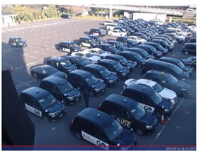
情報発信中【第1待機所】